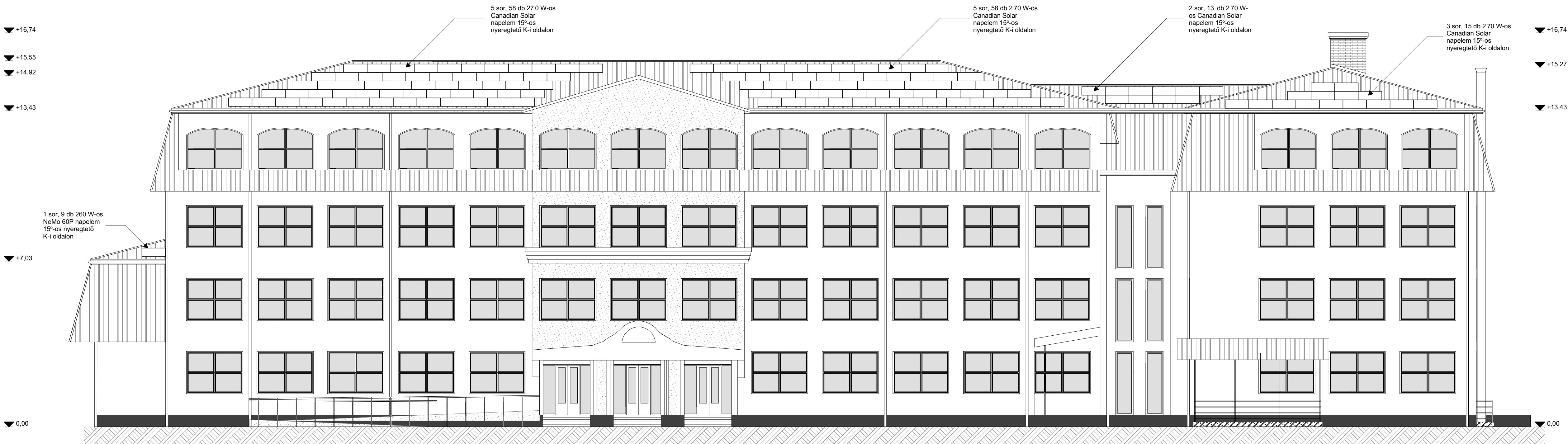
Nyugati homlokzat M=1:100