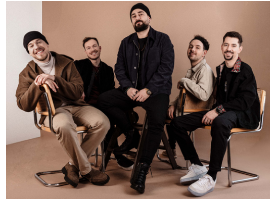
4S Street zenekar