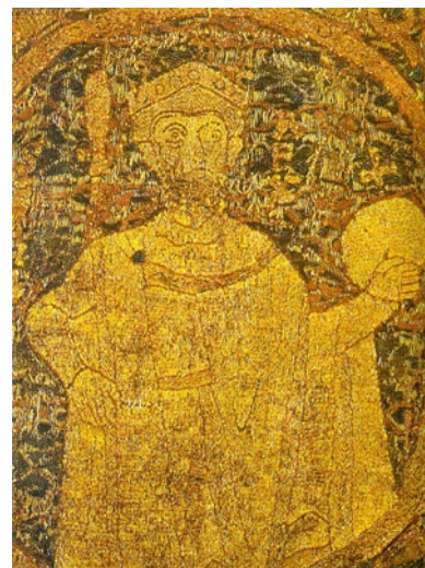
I. István, magyar király, a koronázási paláston

Akárhogy is, ami egykor I. István király révén megvalósult , az a mai korokban is időszerűnek tűnik. Ez pedig az alkalmazkodás Európához . Annak is főleg a nyugati területeihez. Ki ne tudná, hogy egykor István felvéve a keresztény vallást, voltaképp azt segítette elő, hogy egy korábban keleti tájakról Európa belseje felé vándorló, majd ott megállapodó nép tartósan meg tudjon maradni, ne csak múltja, de jövője is lehessen. Mondhatjuk tehát, hogy ésszerű, praktikus és szükségszerű döntést hozott államalapító királyunk, országunk vezetője. Manapság is megszívlelendő az efféle gondolkodás.